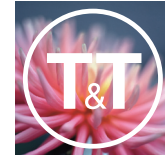
Tuvestad & Thorn AB Marknadskommunikation

Tuvestad och Thorn är ett företag som erbjuder tjänster inom marknadskommunikation och design och som utarbetat en processororienterad metod för marknadsföring av bland annat bostadsprojekt.